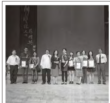
蘇治芬縣長與散文類得獎者合影