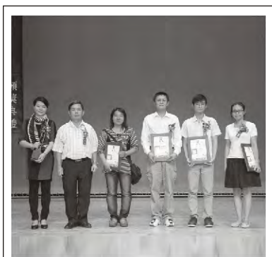
國家文藝獎得主宋澤萊老師 與新詩類得獎者合影